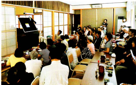
ブラックライトシアター「お父さんといっちゃん」の実践

平成二十三年に親鸞聖人七百五十回大遠忌法要の十勝組お待ち受け法要に併せて立ち上げたブラックライトシアター「お父さんといっちゃん」は、東日本大震災に十勝組で災害支援に出向した時に出会った物語です。その物語を絵本化するために一年間を費やしましたが、総会で否決となり、かなり厳しいご意見もいただきました。これまで年に一度、子どもたちを招いて研修会を開催して参りましたが、ある年度は一人の参加者もないこともあり、時代とともに子どもたちの置かれている状況が激変したものか、