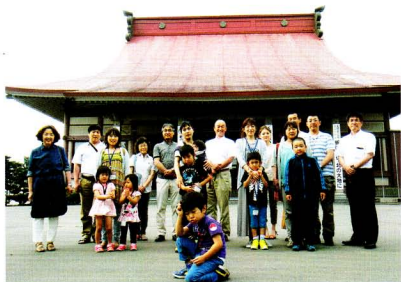
参加家族と帯広別院前で記念撮影