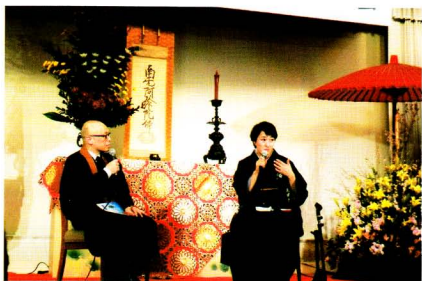
全道仏社大会より

てつながることが重要になる。お寺は、お葬式の間から本願力・お念仏が伝わる場にならなければならない！と提言がありました。